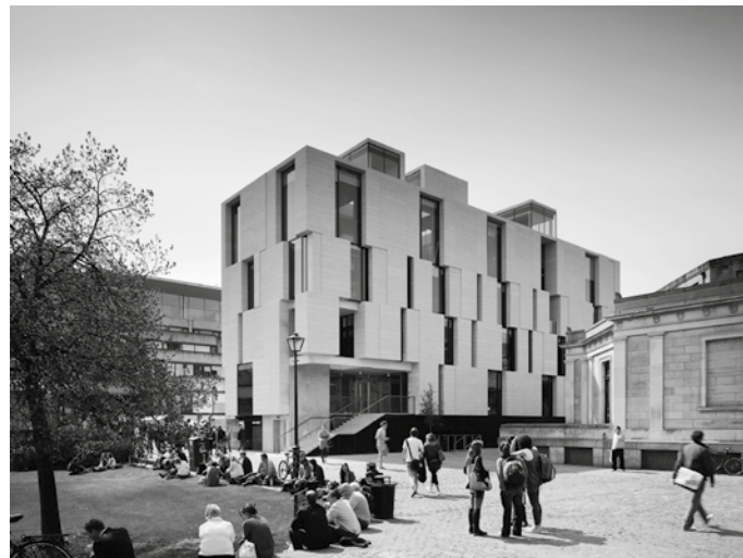
Trinity Long Room Hub

Depuis 1950, Trinity College a grandement contribué à la collection d'architecture moderne dans Dublin, à la fois grâce à de nouveaux bâtiments mais aussi par l'adaptation de bâtiments historiques. La Berkeley Library (1967), faite de béton armé blanc, ou le Dublin Dental Hospital (1894-6), avec son toit audacieux qui fut remodelé par McCullough Mulvin Architects en 2010, en sont de belles illustrations.